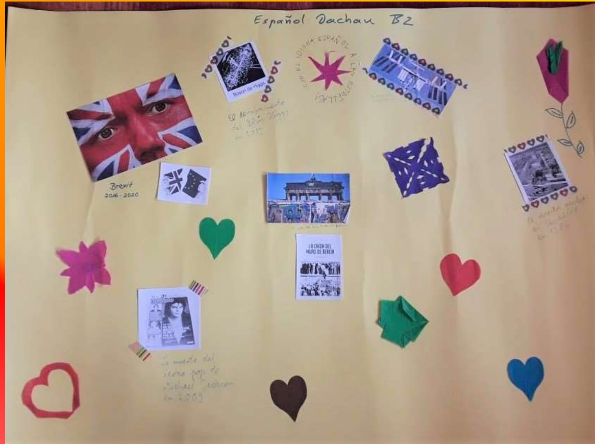
Collage of Carola's Spanish course