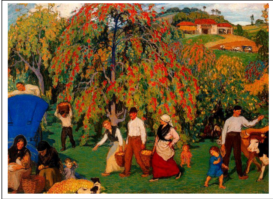
Nicanor Piñole: Recogiendo manzanas , 1922